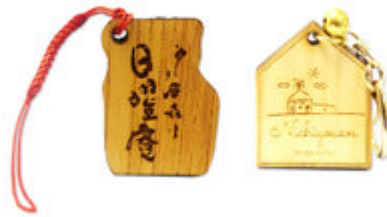
日曜庵コラボグッズ