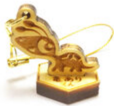
亀ありくんシルエットアクセサリー