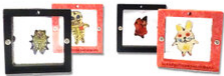
榊原勝敏コラボグッズ